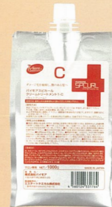
SPCURL CREAM TREATMENT 1-C スピカール クリームトリートメント1-C 1,000g