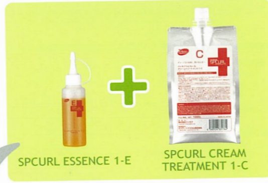
SPCURL ESSENCE 1-E