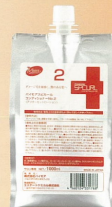
SPCURL CONDITIONER No.2 スピカール コンディショナーNo.2 1,000ml