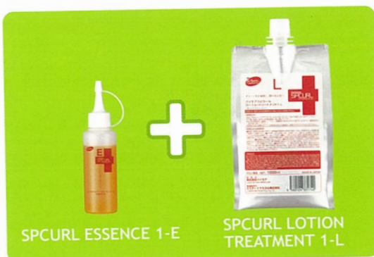
SPCURL ESSENCE 1-E