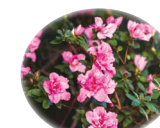
ロドデンドロンフェルギネウム エキス