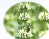
ニガハッカ エキス