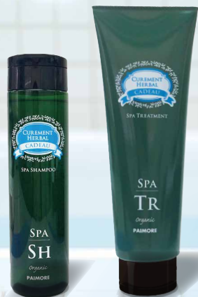
ヘアシャンプー ヘアトリートメント

※香りによるマスキング ■ バイモア キャドゥ スパトリートメント 230g ¥1,980(税込)