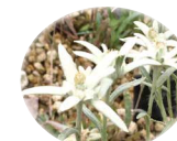
エーデルワイス エキス